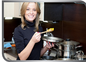
cook/prepare the meals