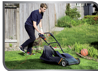
mow the lawn