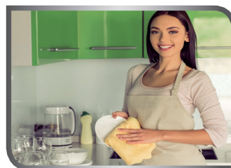
dry the dishes