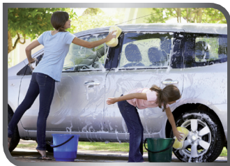
wash the car