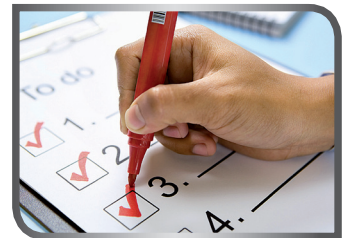
make a to-do list