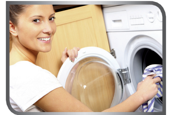
do the laundry