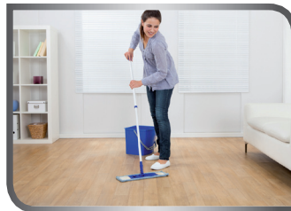
mop the floor