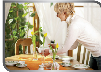
set the table