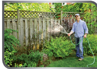
water the plants