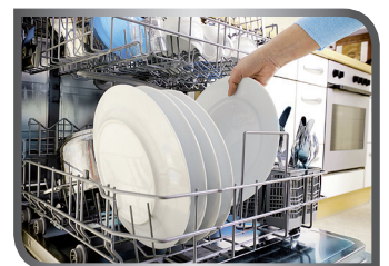
load/empty the dishwasher