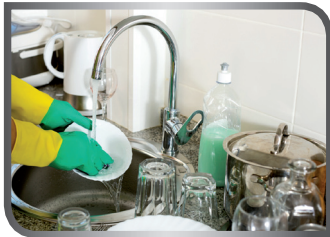
wash the dishes