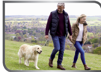
walk the dog