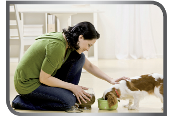
take care of the dog