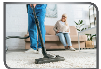
vacuum the carpets