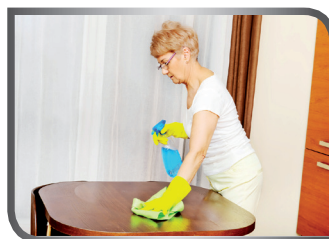
dust the furniture