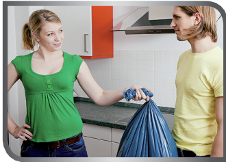
take out the garbage